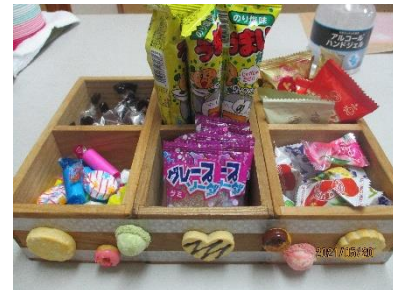
おやつどれにしようかな?