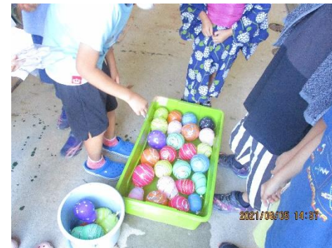
夏祭りでヨーヨーすくい!

クッキング（土曜、祝日、長期休み中の昼食のことです）とおやつは 無償 で提供させていただきます!!