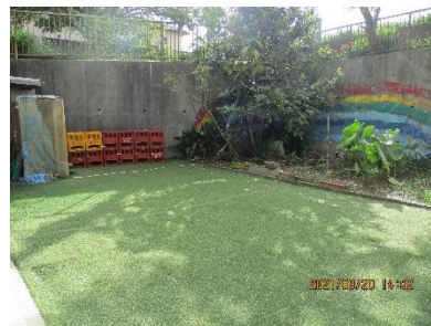
人工芝の中庭であそぼう!