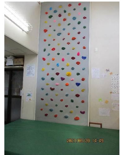
ボルダリングに挑戦!